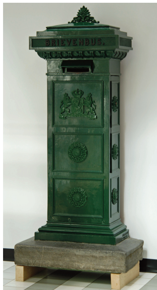
Standaard brievendus (1870)

Nieuwjaarsdrukte op het postkantoor 1930 http://www.youtube.com/watch?v=sdAcle5cNzs