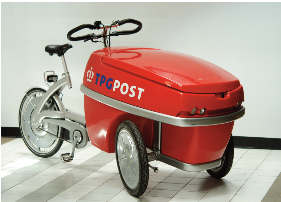
'Roodrunner', fietskar voor postbodes (2001)