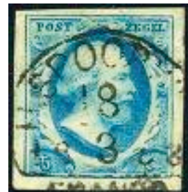
De eerste Nederlandse postzegel (1852)

In 1806 wordt Lodewijk Napoleon Koning van Nederland. Na zijn vertrek blijft de Franse invloed in Nederland merkbaar. In 1810 wordt de nieuwe postwet ingevoerd die hetzelfde is als in Frankrijk. Overal gaan dezelfde regels en tarieven gelden. In 1850 komt er de 'Eerste Postwet van het Koninkrijk der Nederlanden'. In deze wet staat de dienstverlening van de post voorop. In de postwet staat bijvoorbeeld dat er meer postkantoren moeten komen met meer personeel. Dat brievenbussen geplaatst moeten worden, maar ook dat de tarieven voor het verzenden van de post omlaag moeten. Een ander belangrijk punt uit de postwet is het invoeren van de postzegel. Eerst is het zo dat je bij ontvangst van een brief aan de bode moet betalen. Door de postzegel is dit veranderd, de afzender kan nu betalen voor het verzenden van de brief. In 1852 worden de eerste postzegels uitgegeven. Op deze postzegels is een afbeelding van koning Willem III te zien. De eerste postzegels hebben een waarde van 5, 10 of 15 cent. Het aantal postzegels dat je moest plakken, hing af van de afstand waarover de brief moest worden vervoerd. Boven de vijftien gram moest je ook extra betalen voor het gewicht. Vanaf 1870 wordt het gebruik van de postzegel verplicht.