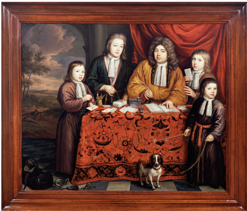
Postmeester Lambert Twent (1695)

Het bezorgen van de post op een traject met veel brieven, kan een flink inkomen opleveren voor de bode. Een bode neemt bodelopers in dienst en wordt zelf postmeester. Met de komst van de eerste postmeesters rond 1650, wordt het postvervoer bedrijfsmatig georganiseerd. Postmeester zijn is een belangrijke baan. Zo belangrijk, dat het beroep vaak in de familie blijft en overgaat van vader op zoon. Het meest interessant voor de postmeesters zijn de postdiensten tussen de grote steden. De post wordt hier regelmatig bezorgd. Op het platteland wordt bijna geen post bezorgd, omdat dit niet voldoende geld oplevert. Het gaat de postmeesters niet om de post zo goed mogelijk te bezorgen, maar om zoveel mogelijk geld te verdienen. Postroutes naar het buitenland zijn voor de postmeesters een belangrijke bron van inkomsten.