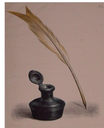
Inktpot en ganzenveer

Na een studie kunstgeschiedenis aan de Universiteit met een bijvak museumkunde.